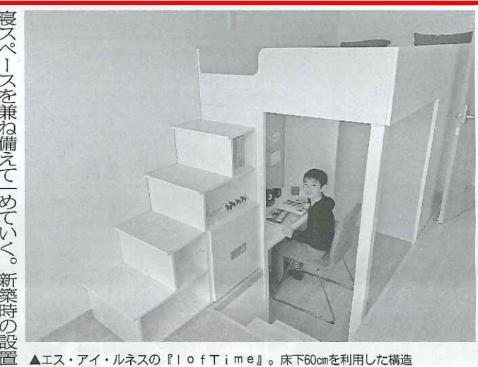
▲エス・アイ・ルネスの『loftime』。床下60cmを利用した構造

ハンガーポールの色はミルクホワイトと木目調パーチカラーの2種類があり、部屋の内装に合わせることができる。サイズは幅が540×1650mmまで4種類ある。耐荷重は、ハンガーポールと棚それぞれ10kgまで。定価は7600円（税別）から。