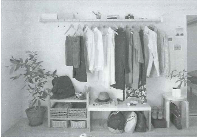
▲森田アルミの『Wally』。壁にネジ4本で固定し、手軽に取り付けられる

単身向け賃貸住宅ではクローゼット、ファミリールームではウォークインクローゼットが、新築マンションには欠かせない設備の一つになっている。玄関にはシューズボックス、キッチンにはパ